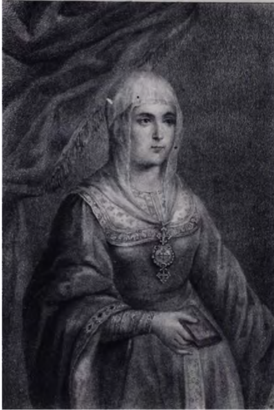
DOÑA ISABEL LA CATÓLICA REYNA DE CASTILLA.