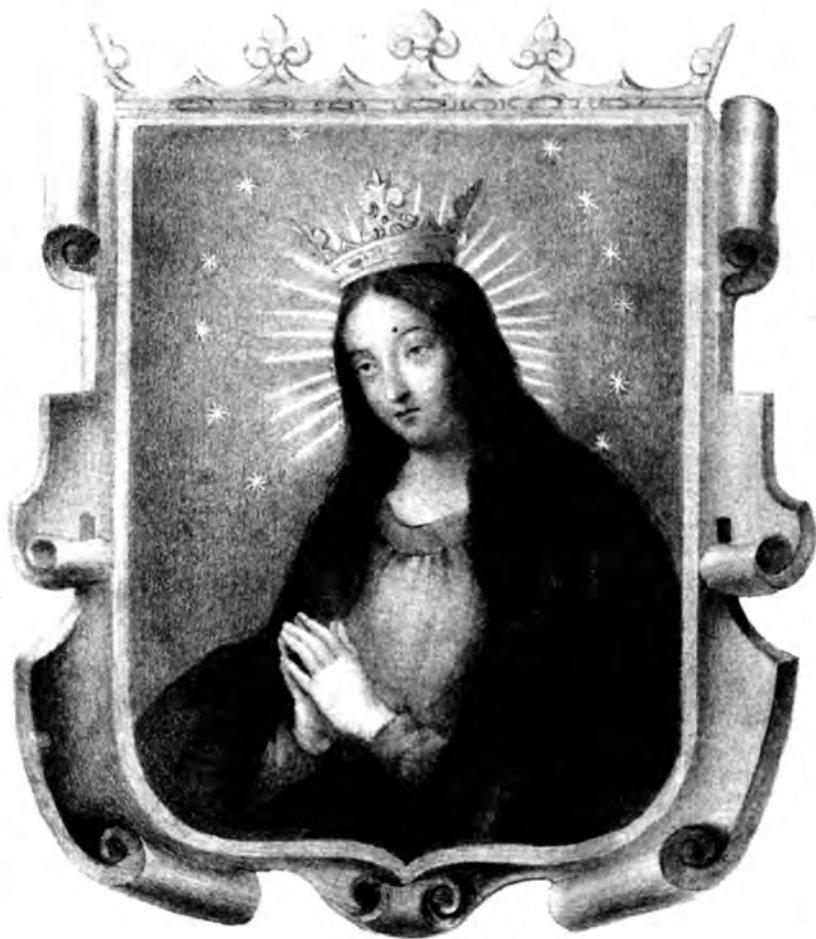
ESTANDARTE QUE TRAJÓ D. FERNANDO CORTÉS EN LA CONQUISTA DE MÉXICO