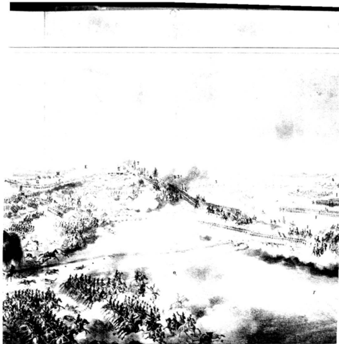
ALLA DE OCOTLAN. Dada en los terrenos de la Hacienda de San Isidro, El día 8 de Marzo de 1856.