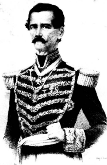
EL GENERAL DE DIVISION D. FLORENCIO VILLAREAL.